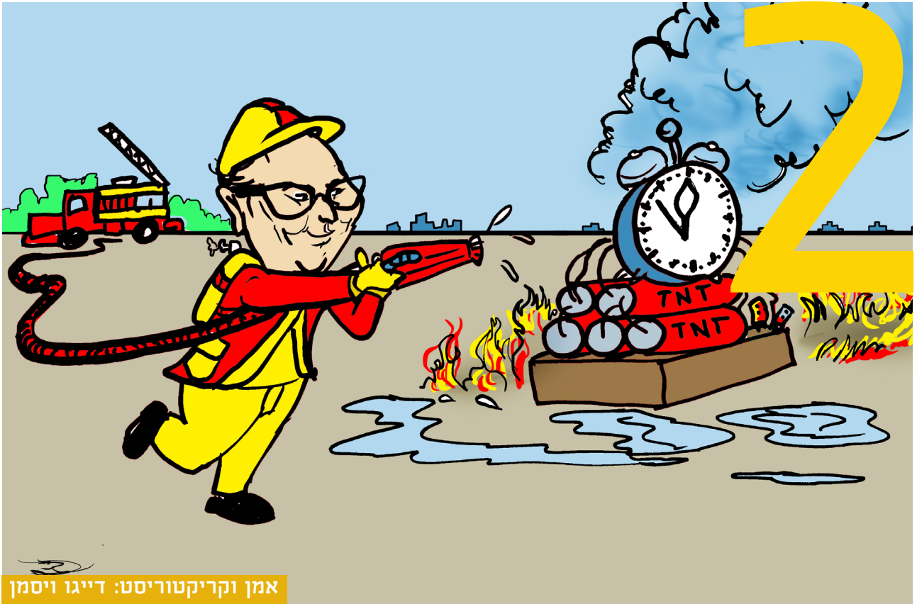
אמן וקריקטוריסט: דייגו ויסמן