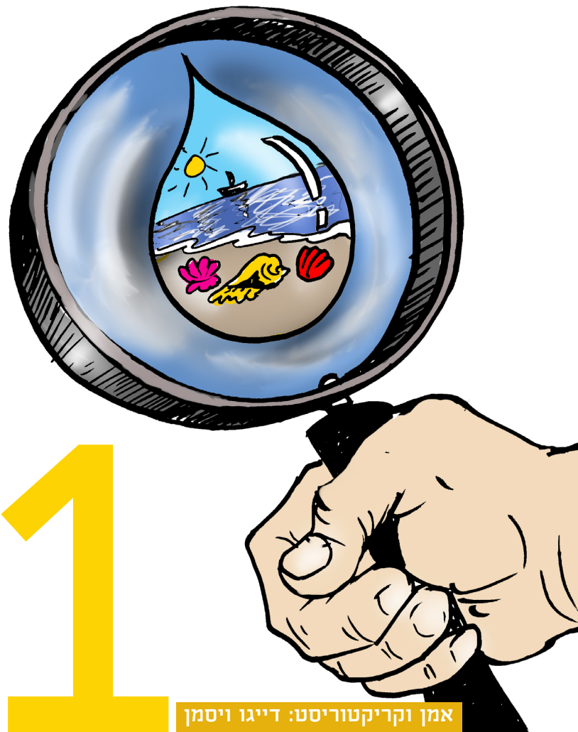
אמן וקריקטוריסט: דייגו ויסמן

האם צריך להסביר את הקריקטורה או שאפשר להבין את המסר מתוך הציור?