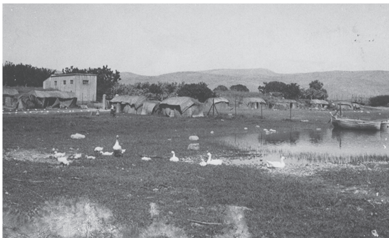
תמונה 4: אוהלים ממחצלות קנים ומבנה חצר הזיכיון ביום קבלתו, 28.11.1934

העבודות". 35 ארתור רופין דחה את דברי המבקרים, שטענו שזיכיון החולה הוא עסק יקר מאוד ושאינו ראוי להשקעות: "עוון לא יכופר היה זה אילו היתה חברת הכשרת הישוב מחמיצה את ההזדמנות לרכוש את קרקעות חולה, המאפשרות התישבות של אלפי משפחות". 36