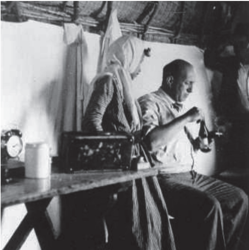
תמונה 2: מָר באחת מתחנות האוניברסיטה העברית על גדות החולה

במסגרת עבודת הפיקוח שלו. 31 ממרפסת ביתו היה אפשר לצפות לעבר עמק החולה, שבעיני רוחו ראה אותו מָר כחבל התיישבות יהודית. מכיוון שאחד הגורמים שבלמו את ההתיישבות היה המלריה, הקדיש מָר את חייו מכאן ואילך להדברת המלריה ולקידום ההתיישבות בחבל ארץ זה.