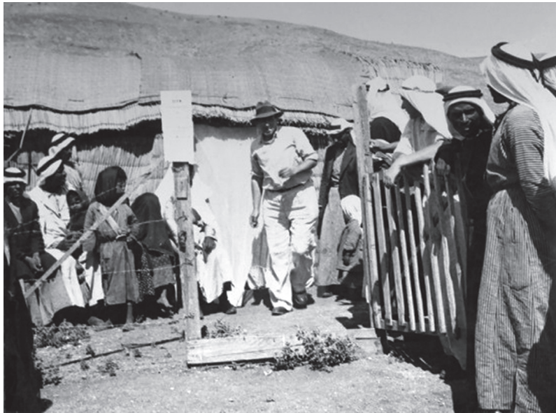
תמונה 1: מֶר במרפאה בכפר סלחיה

ליתושים שנמצאו באיילת השחר, לשם הגיעו, להערכתם, ישירות מאזורי הקיבוץ. 29