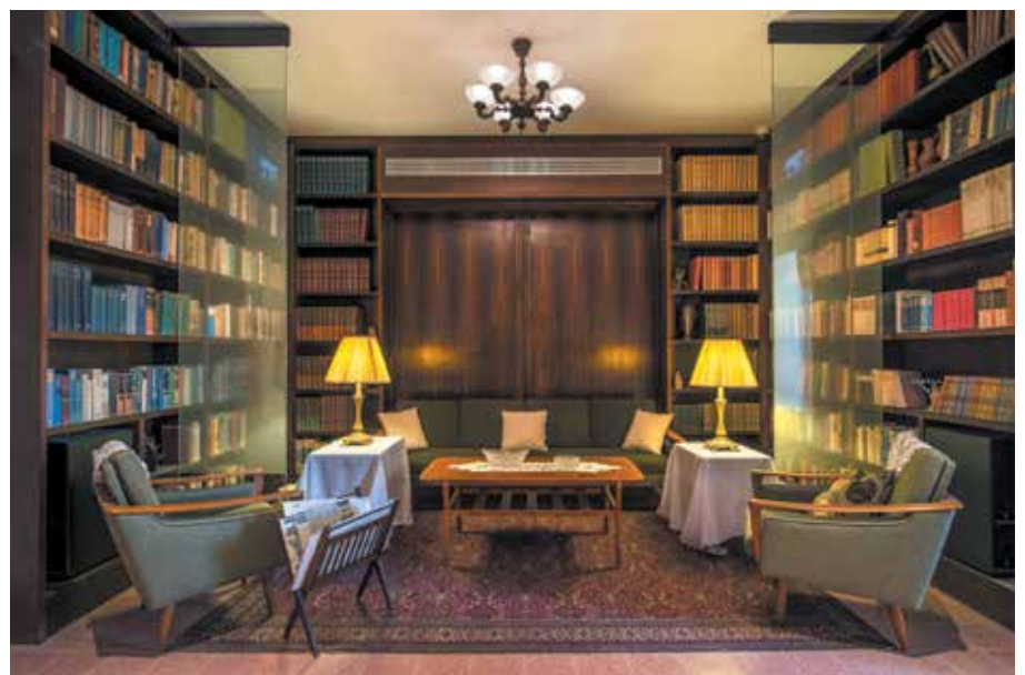
בית לוי אשכול בירושלים