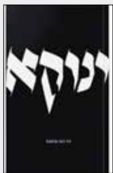
ינוקא דוד ניאו בוחבוט הבה לאור, 51 עמ'

רְקִיעַ שְׁתֵּי רוֹקֵעַ בְּרִגְלָיו מְעֻלָּיו / אֶךְ יֵלֵד יָתוֹם יִחְרִישׁ מְעֻלְלָיו בְּאֶשֶׁר יִחַלֵּם / עוֹלָם שְׂמִימִי בְּאוֹר הַיּוֹם / יִקְיץ פְּאָרְנָבֶת אֶל פִּי שֶׁל נִחְשׁ הַדְּמִיוֹן / שְׂיִלְפֶת וְיִתִּיר // אֶת חֶבְלוֹ הַטְּבוּרִי / מְשַׁבֵּה הָרָחֵם הַטְּרִי / תַּחַת שְׂמִים טְהוֹרִים; / שִׁירָה יִתִּיר.