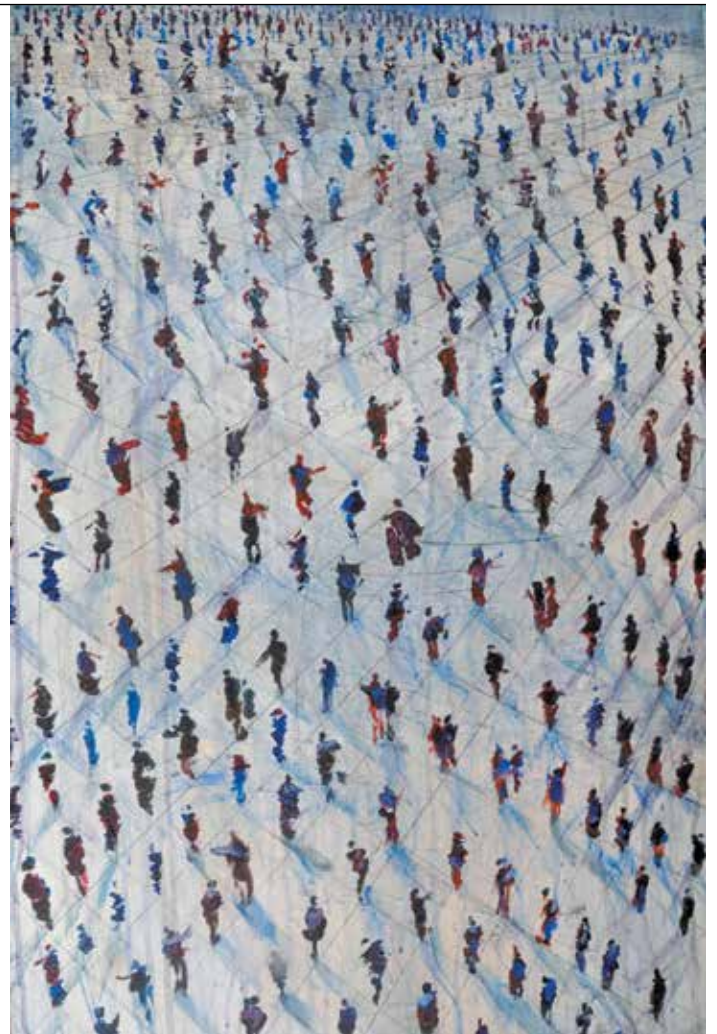
עמי שנער, "הפגנה לא מנומסת בכיכר רבין" (פרט), אקריליק על בד, 2021. מתוך התערוכה "לך לך" שהוצגה בבית האמנים בראשון לציון.