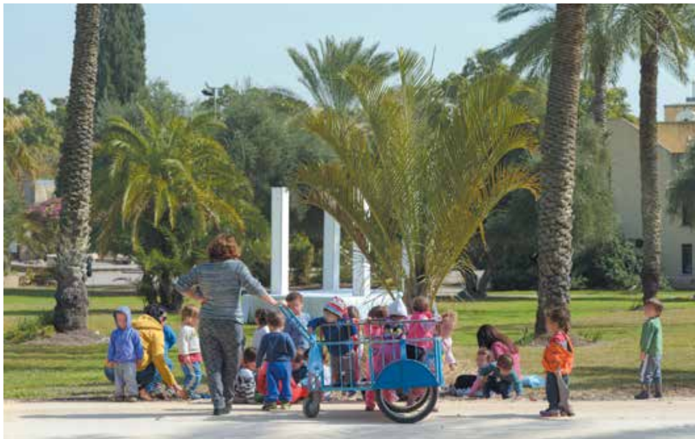
הקיבוץ הדתי טירת צבי

הראי"ה קוק תמך בצדק חברתי, ואף ראה בביטול הרכוש הפרטי אוטופיה תורנית. הוא לא היה היחיד בהשקפות אלו בין הוגי הצינונות הדתית של אותה תקופה / יהונתן גארב /