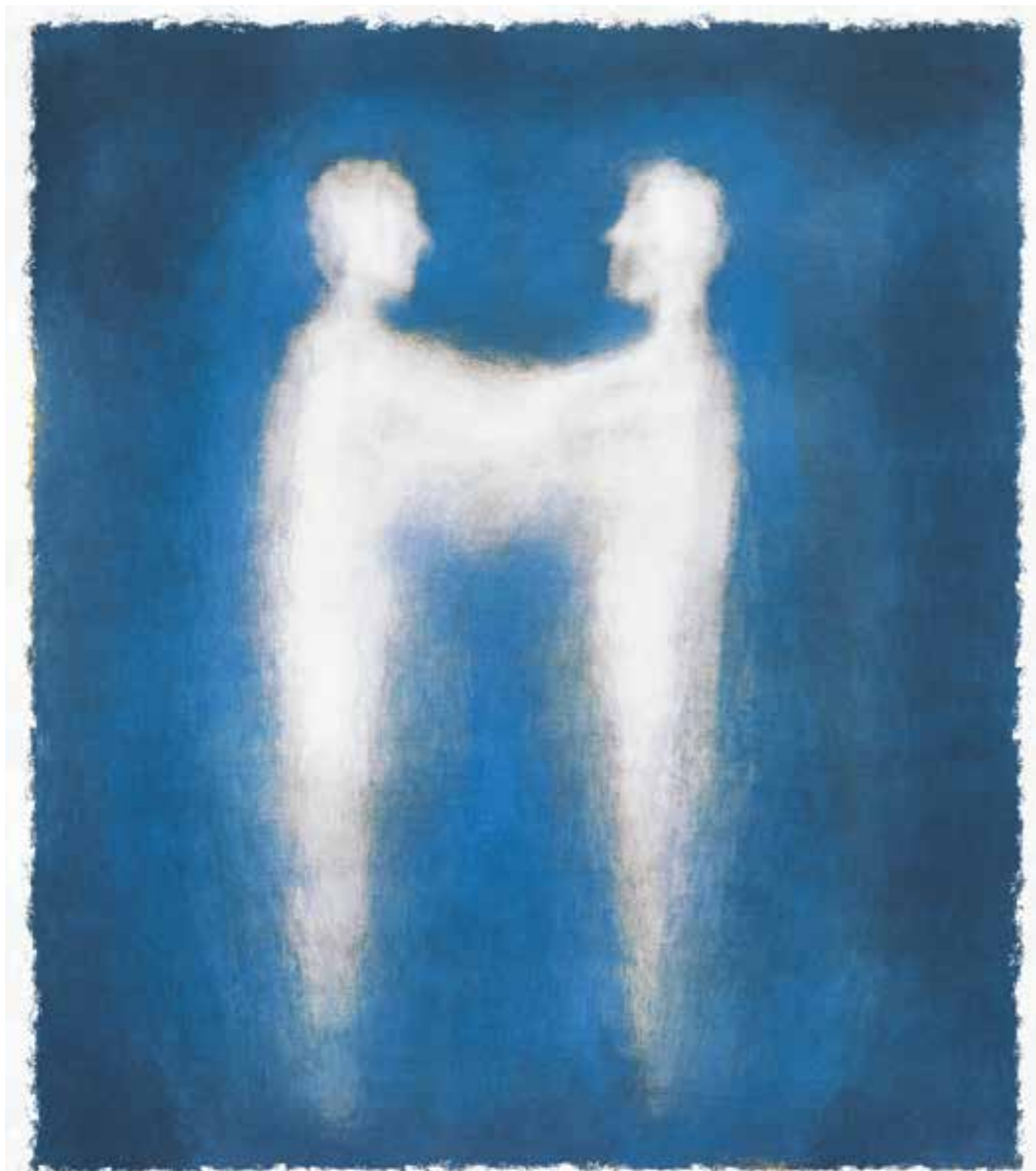
איור: מנחם הלברשט

לאחר קבלת התורה עם ישראל איננו נכנס לבית המדרש אלא מגויס למיזם בנייה לאומי, שנועד לשמר את רגע האחדות הנדיר למרגלות הר סיני / שירה מרילי מירוויס /