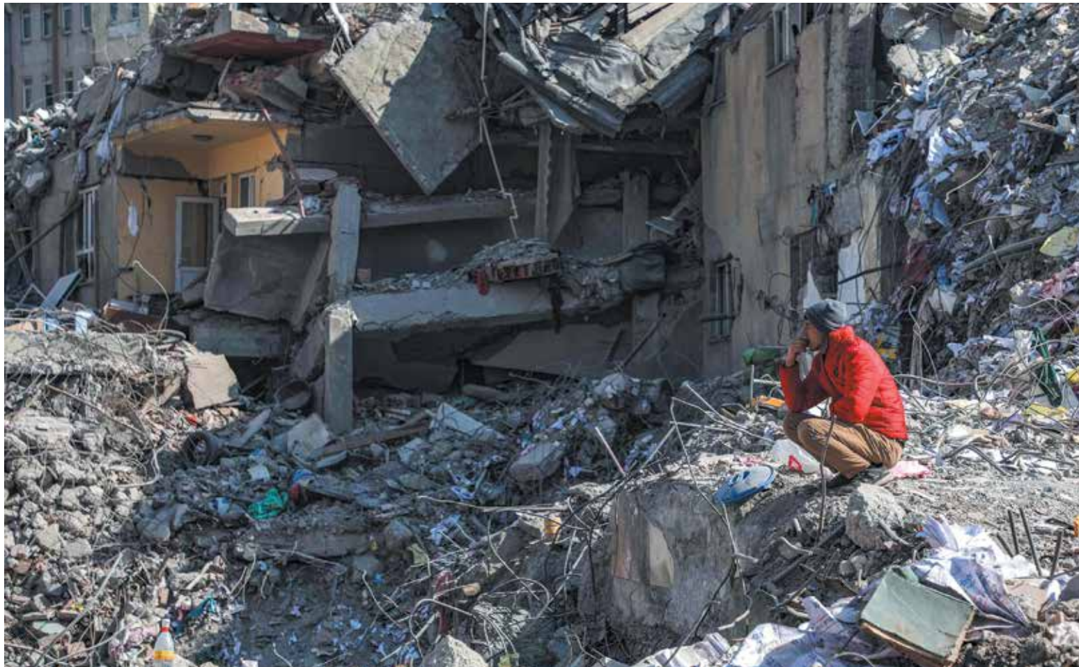
שאלת מקורו של הסבל האנושי מתעוררת במלוא עוצמתה. הריסות רעידת האדמה בקהרמאנמרש, טורקיה