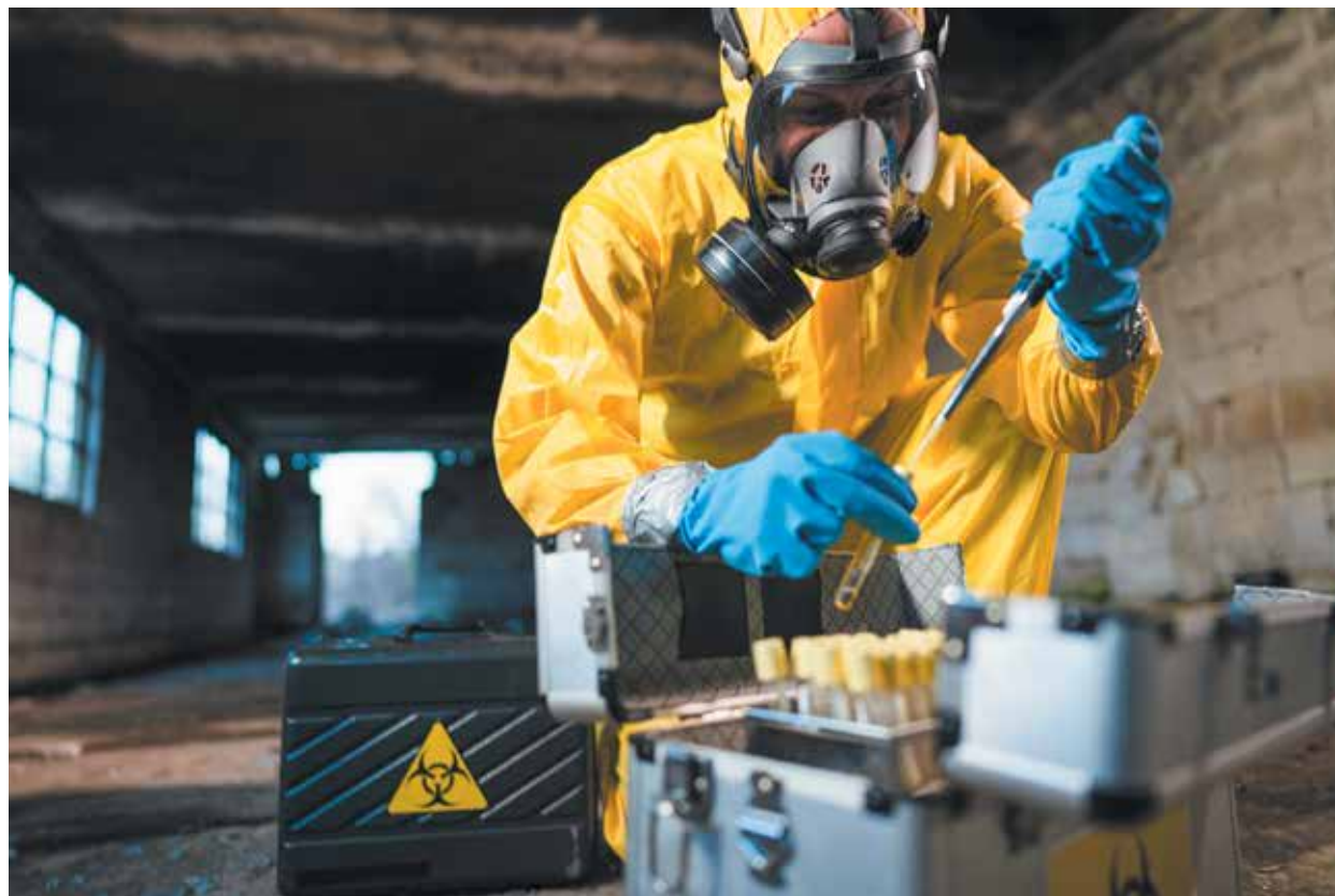
חשד שנגיף קטלני הונדס בוורשה על ידי פרופסור שונא ישראל

העלילה נפתחת בכך שהרמטכ"ל, רבי-אלוף זאב תל-דוד, ניצול שואה בעצמו, מוצא את מותו בנסי-בות שנראות כמו דום לב, בשעה שהוא נוסע למנ-