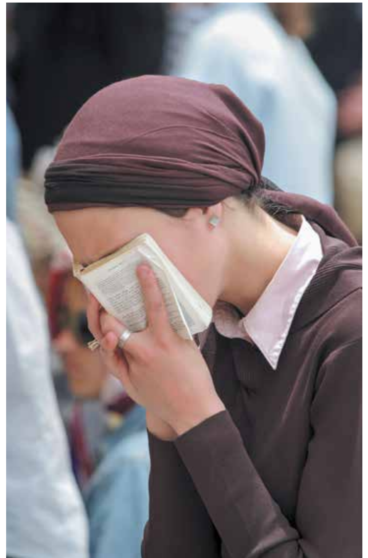
“רק האדם מסוגל לדבר, ולו לרגע, בגוף ראשון בשם ה'”

מסמך אישי של מתפללת, שנראה שרק אישה הייתה מסוגלת לכתוב אותו, דן בסדר התפילה ונוסחה, בשאלות על היכולת להתפלל בכנות תוך דילוג ופרשנות אישית, ובסוד ההתכללות הקבלי / אמונה אלון /