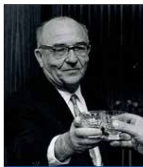
גישור בשיטת אשכול

יהיו בורים ועמי ארצות. באזור מוצאי באוקראינה, היהודי היה מכניס את הפרה שלו לרפת עם פסוק מהתורה או בציטטה מהתלמוד. את זה אני רוצה". אשכול זכה לאהדה חוצת מחנות, והיה ראש הממשלה היחיד מטעם מפא"י שהגיע לנאום בוועידת מפלגת חירות. "הוא לא בא כדי להגיד 'אני צודק ואתם טועים', או 'אני בשלטון ואתם באופוזיציה', אלא כדי לכבד אותם, ומתוך ראיית החשיבות העצומה שביצירת גשר בין כל חלקי העם. בנאומו הבהיר שהוא מודע להבדלים המהותיים, אך גם למה שמחבר. הוא אמר שם, בין השאר: 'האופוזיציה מהווה חלק אינטימי במסכת החיים הפרלמנטריים והממלכתיים. מחובתנו לחפש תמיד את האינטרס הלאומי המשותף הכריז, לל, אשר מאחוריו ניצב העם כולו'. היכולת שלו לראות אנשים כפי שהם אפשרה לו להגיע ללבבות. הוא היה מנהיג במובן החברתי והתרבותי הרבה לפני הפוליטי".